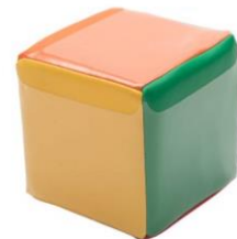
Move cube, per stuk