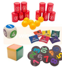
Bewegend leren spelpakket basis

We hebben maar liefst een bedrag van 330 euro bij elkaar gespaard!! Allemaal nogmaals bedankt voor het meespelen met de Doekoe actie. We hebben de volgende spelmaterialen besteld: